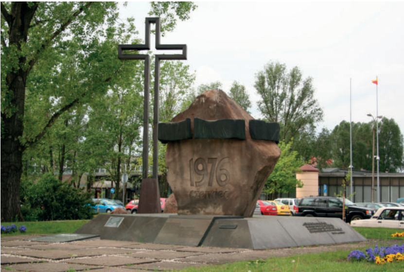
Pomnik upamiętniający Czerwiec 1976

Na podstawie filmu edukacyjnego Opozycja w latach 70. – powstanie KOR-u , materiałów źródłowych oraz własnej wiedzy odpowiedz na kilka pytań.