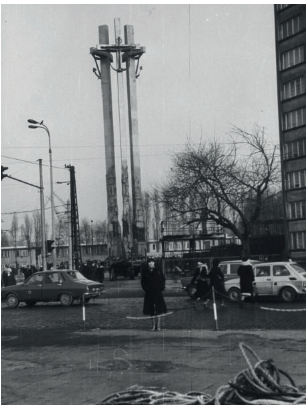
Pomnik poświęcony ofiarom Grudnia 1970