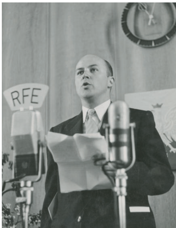
Jan Nowak-Jeziorański przed mikrofonem w Radiu Wolna Europa