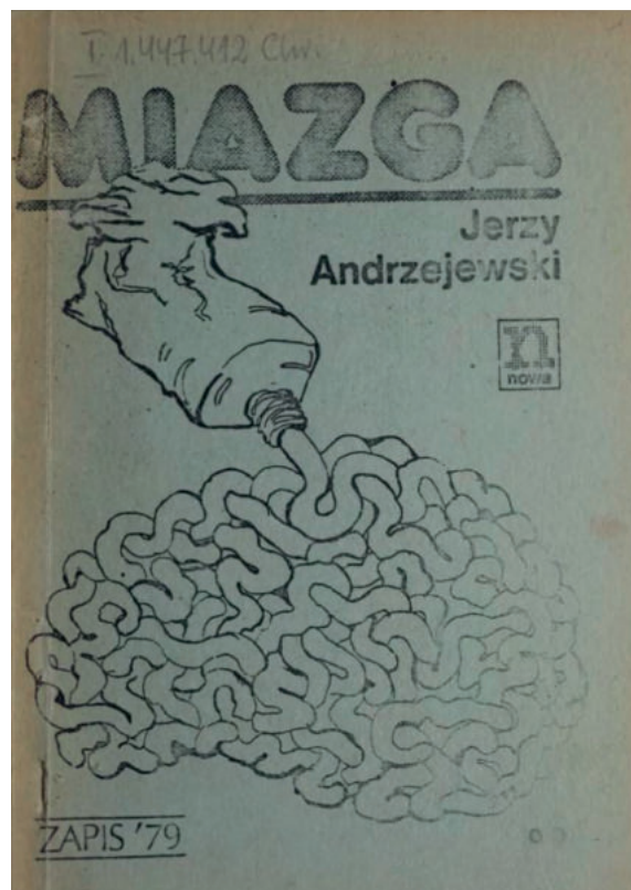
Jerzy Andrzejewski, Miazga , 1979